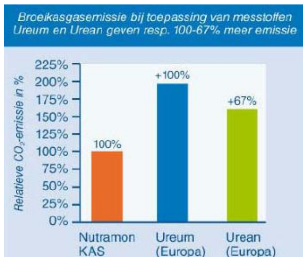
Grafiek 2: CO2-emissieverschillen tussen Nutramon KAS, ureum en urean bij gebruik

* 'Europa' betekent geproduceerd met de best beschikbare techniek die algemeen inzetbaar is bij de productie in Europese fabrieken.